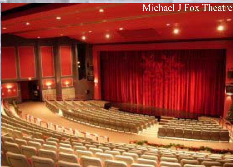
Michael J Fox Theatre

Seattle & Portland ဇေယျာကျော် (206) 850-3818 ခင်မောင်တင် (425) 558-4287